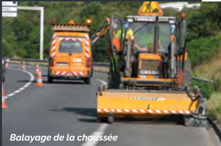
Balayage de la chaussée