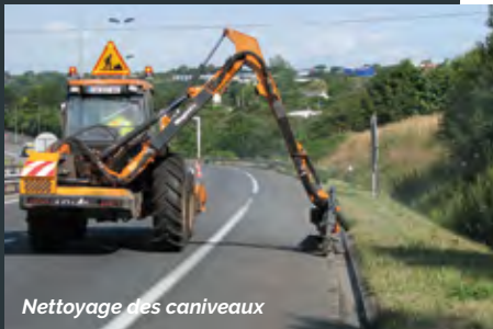
Nettoyage des caniveaux

Faciliter vos déplacements au quotidien et pour demain