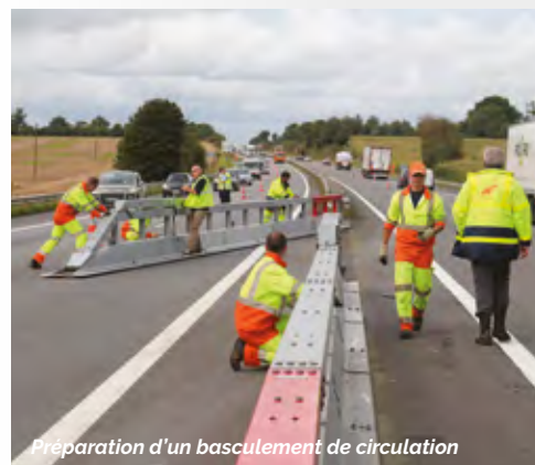
Préparation d'un basculement de circulation