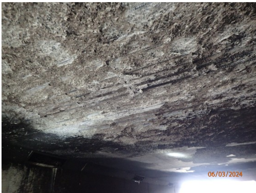
Domages au niveau du pont